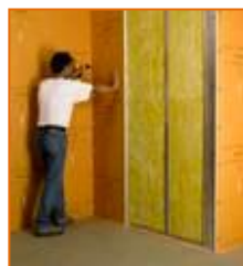
Sobre estructuras metálicas o de madera