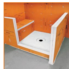
Asientos / Estantes