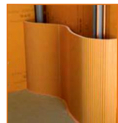
Superficies curvadas y columnas