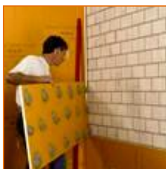
Nivelación de soportes con irregularidades