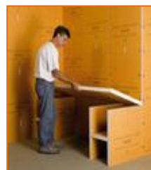
Encimeras de lavabos y estantes