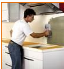
Encimeras de cocinas