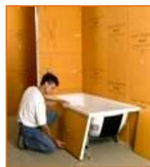
Revestimiento de bañeras y duchas